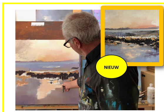
Titel: Waterland 4

Ook in 2026 zullen er weer een aantal exposities georganiseerd worden en mogelijk een of twee nieuwe kunstwerken aangeschaft worden.