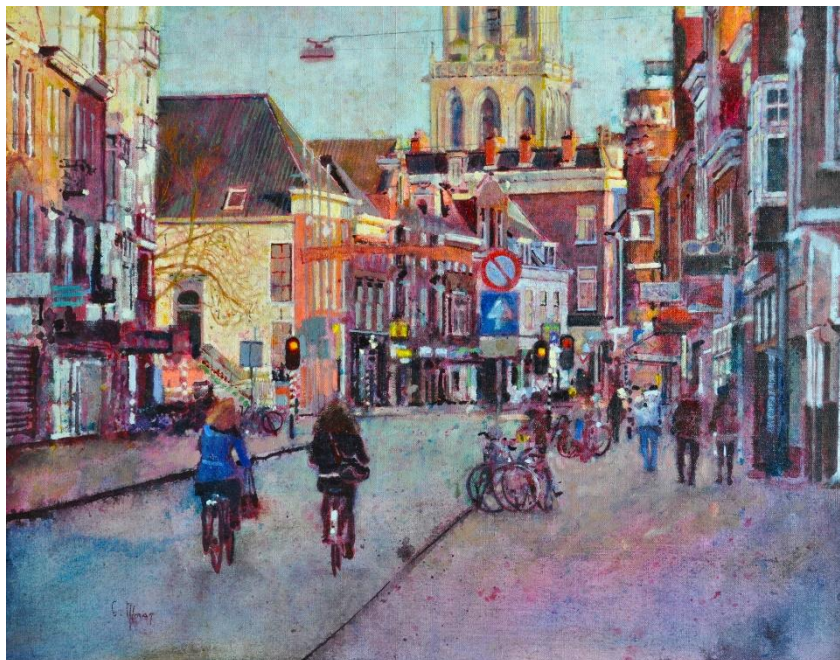
Kunstenaar: Christiaan Afman Jaar van aankoop: 2013