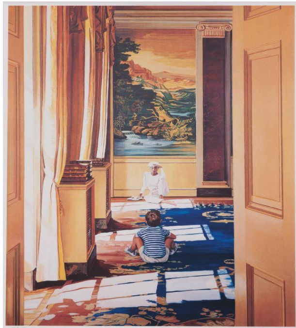
Kunstenaar: Jan Worst Jaar van aankoop: 2023