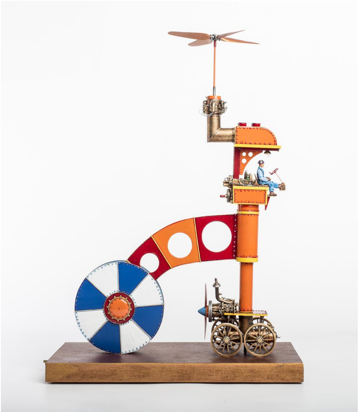
Kunstenaar: Harry Arling Jaar van aanschaf: 2013