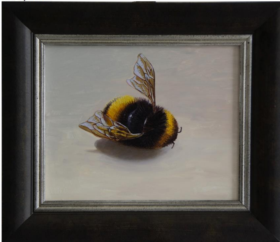
Kunstenaar: Martin Horneman Jaar van aankoop: maart 2019